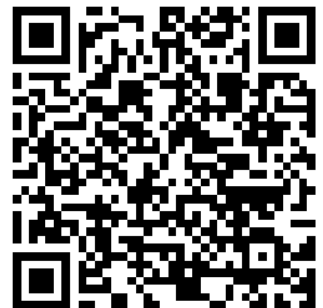
Video: Probenentnahme beim Reh

3. Probenmaterial in Probengefäß überführen und bis zum Versand tiefgefroren lagern