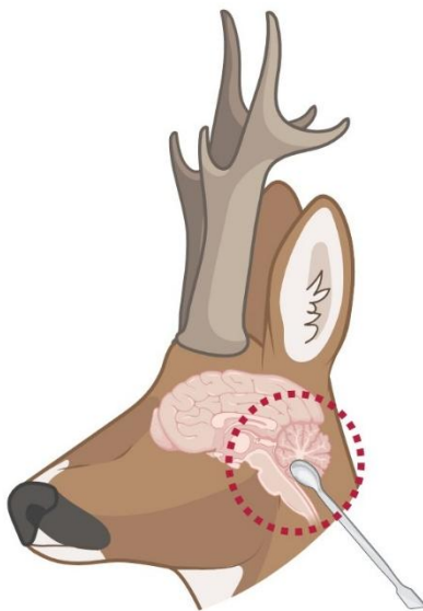
Gehirnprobenentnahme beim Rehwild (illustriert mit Biorender.com)

Die Gehirnprobe wird bevorzugt für die CWD-Untersuchung verwendet!