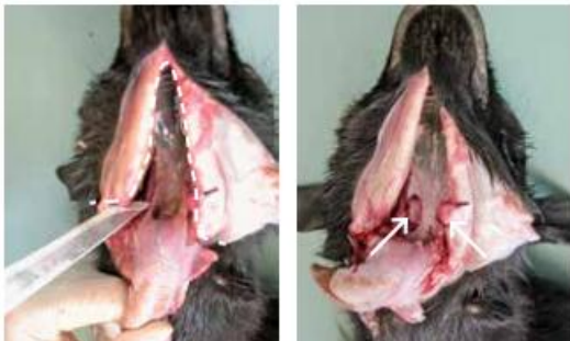
Blick auf die tiefen Halslymphknoten nach Entfernen des Gescheides (Siehe: https://www.sg.ch )